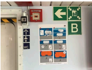
Bedienelemente / Leitsystem