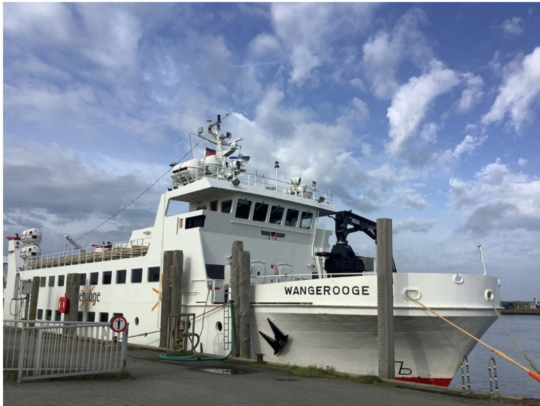
MS Wangerooge