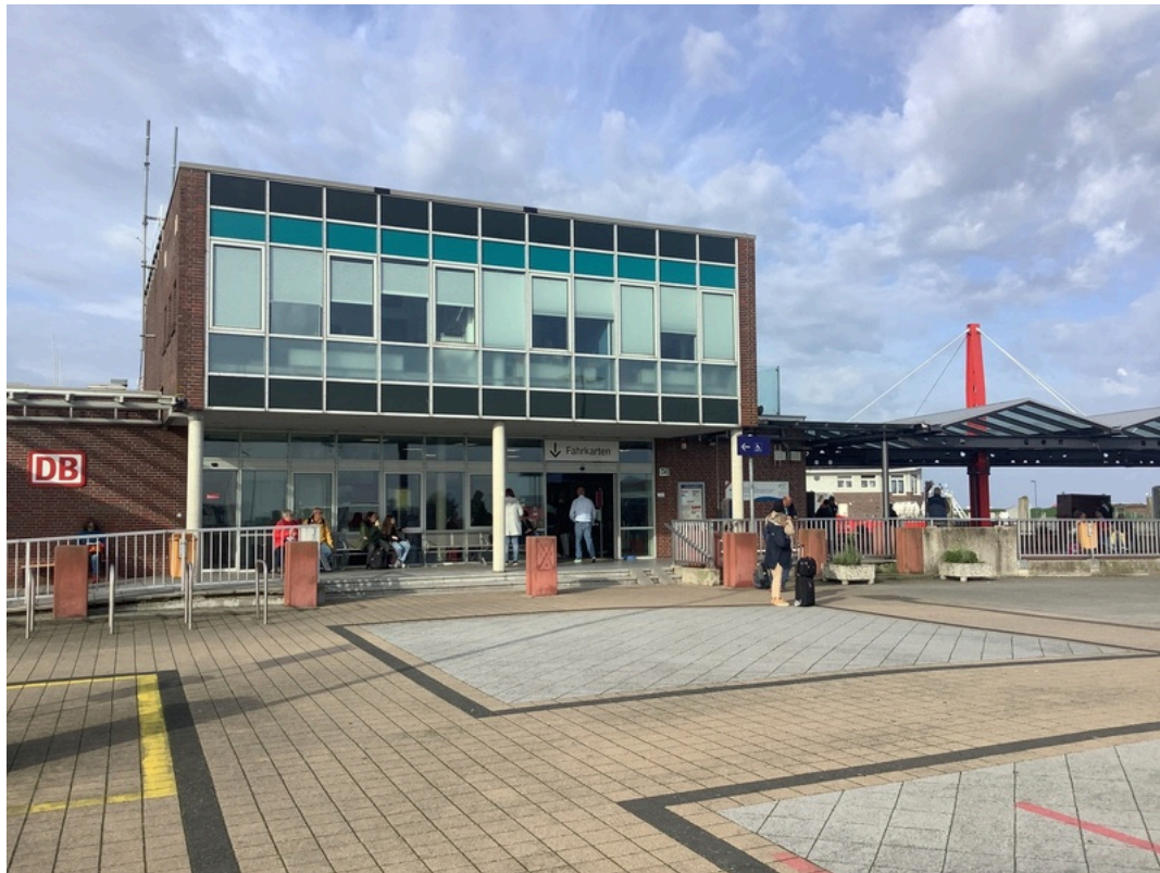
Fähranleger Harlesiel