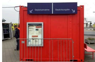
Bedienelemente / Leitsystem