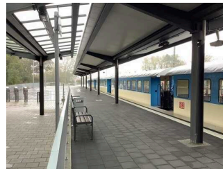
Bahnsteig / Gleis