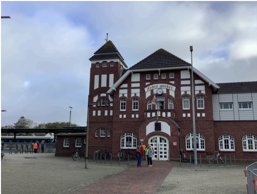
Bahnhof Wangerooge