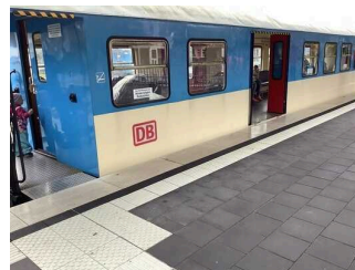
Waggon für Menschen mit Behinderung und Kinderwagen